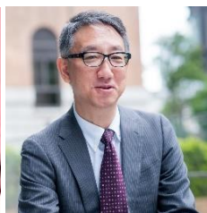
KOKコンサルティング代表 中小企業診断士