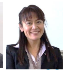
NPO法人 男女共同参画あおた 理事長