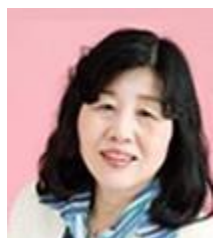
公益社団法人 日本サードセクター 経営者協会 執行理事