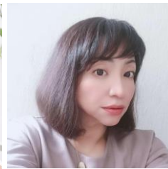
一般社団法人 ウーマンキッズラボ 代表理事